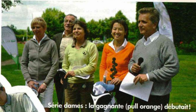
Série dames : la gagnante (pull orange) débutait!