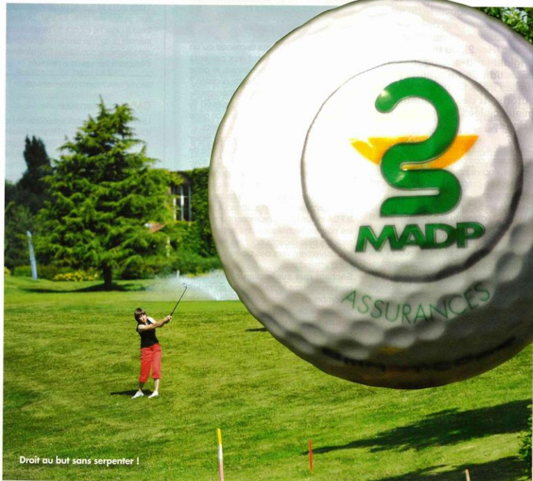
Droit au but sans serpenter !

La 2 e Coupe de golf des pharmaciens et biologistes, organisée en partenariat par MADP Assurances, Impact Pharmacien, Preven's et RFL, s'est déroulée sous les meilleurs auspices : un premier jour de l'été au temps idéal, cinquante compétiteurs et compétitrices venus pour s'affronter, dès 9 h du matin, dans un climat convivial et confraternel, un parcours de « plaies et bosses » parfaitement soigné, un décor champêtre à vous faire oublier la ville et ses soucis. Le parcours de golf de Bussy-Guermantes, un peu à l'écart de la petite cité de Bussy-Saint-Georges, est réellement l'un des plus beaux greens de France. Et on est en Seine-et-Marne, si près de Paris pourtant !