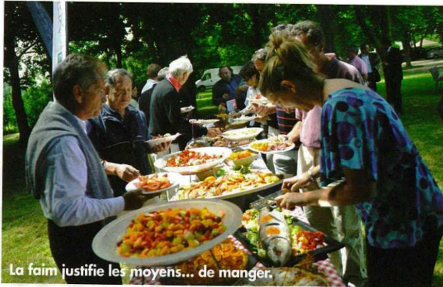
La faim justifie les moyens... de manger.